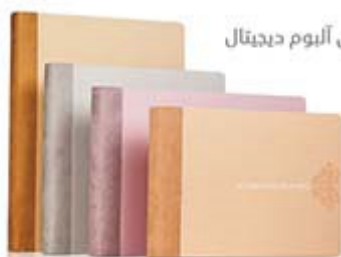
صفافی آلبوم دیجیتال

هدیه به تمام خوانندگان مجله صنعت عکاسی، با وارد کردن کد sanateakkasi در فروشگاه اینترنتی دیدنو از ۱۵٪ تخفیف ویژه تا پایان دی ماه برخوردار شوید.