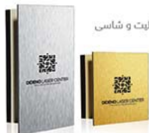
لیت و شاسی