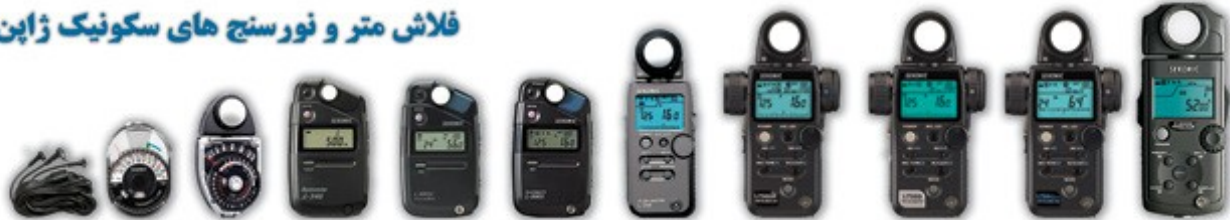
سیم سنسور L-208 نورسنج L-398 نورسنج L-346 لوکس متر L-308 DC سینمایی L-308 S فلاش متر L-358 فلاش متر L-758 DR فلاش متر L-758 D فلاش متر L-758 Cine سینمایی C500 کلرمتر

شما می‌توانید طرز استفاده از فلاش متر و کلرمتر را که توسط Lorenzo Gasperini عکاس مشهور آمریکایی آموزش داده شده در بخش اطلاعات فنی سایت شرکت رنگ سیستم مشاهده نمایید، و یا با ارسال آدرس خود از طریق فرم درخواست می‌توانید DVD اورجینال آن را با زیرنویس فارسی مجاناً دریافت نمایید.