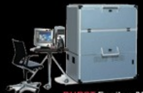
DURST Epsilon 30

انواع لیتر، ریون، فیلتز دارو، چرخ دنده، المنت، سنسور، فلوتر، صفحه کیبورد روتر، لایه، چسبیلیدر، شمار فیلم، فیلتز، پلیر، بلورینگ، تسمه، بیلوی سوپاپ، مگزین، لنتز، آنتی استاتیک، کابل، پمپ تخلیه، پمپ برگردان کارت دینستومتر، بردهای الکترونیکی مربوط به دستگاه های چاپ عکس